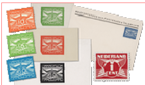
Vrije nieuwsgaring: Dennis

Andere landen waren al eerder bezig met het realiseren van luchtpostverbindingen en -zegels. In Italië werd in 1917 de eerste luchtpostzegel uitgegeven. Een jaar later werden ook in Oostenrijk voor het eerst luchtpostzegels gebruikt. In beide landen kregen bestaande postzegels een extra opdruk. Amerika was in 1918 het eerste land ter wereld dat